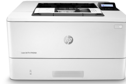
HP LaserJet Pro M404dn

Táto tlačiareň je určená len na prácu s kazetami, ktoré majú nový alebo opätovne použitý čip HP, a používajú dynamické zabezpečovacie opatrenia na blokovanie kaziet s čipom od iného výrobcu ako HP. Pravidelné aktualizácie firmvéru zachovávajú účinnosť týchto opatrení a zablokujú kazety, ktoré predtým fungovali. Opätovne použitý čip HP umožňuje použitie opätovne použitých, repasovaných a opätovne naplnených kaziet. http://www.hp.com/learn/ds