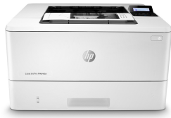
HP LaserJet Pro M404dw

Úspech podniku si vyžaduje rozumnejšiu prácu. Tlačiareň HP LaserJet Pro M404 je navrhnutá tak, aby ste svoj čas vynakladali čo najefektívnejšie – na rast svojho podniku a napredovanie pred konkurenciou.