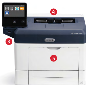
Tiskárna Xerox® VersaLink® B400 Tisk.