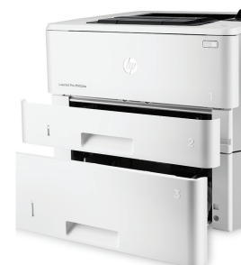
HP LaserJet Pro M402dn s volitelným zásobníkem na 550 listů