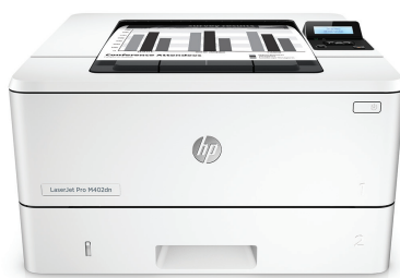
Tiskárna HP LaserJet Pro M402dn

Tiskový výkon a silné zabezpečení odpovídající způsobu vaší práce. Tato výkonná tiskárna dokončí tiskové úlohy rychleji a je vybavena ucelenými funkcemi zabezpečení na ochranu před hrozbami. 1 Originální tonerové kazety HP s technologií JetIntelligence vytisknou více stránek. 2