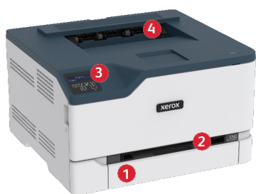
Barevná tiskárna Xerox® C230