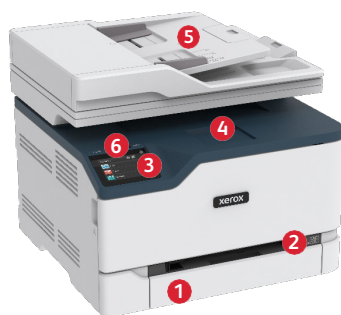
Multifunkční barevná tiskárna Xerox® C235