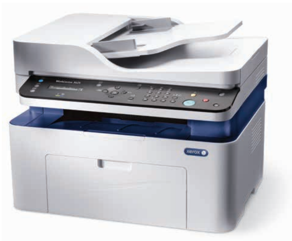
WorkCentre 3025: kopírování, tisk, skenování, faxování.*

* Fax a automatický podavač dokumentů jsou k dispozici jen se zařízením WorkCentre 3025NI.